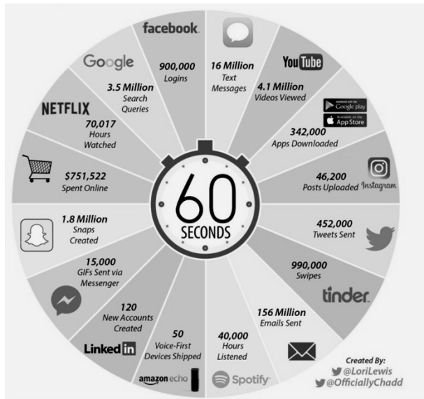
Imagen 1: Internet en 60 segundos 1

¿Sabe usted cuantas y qué cosas ocurren en Internet en un minuto?; pues como podemos ver en la figura 1, la movida es grande. Más de 452.000 tweets, cerca de 342.000 Apps descargadas, 156 millones de correos electrónicos son enviados; mas de 3 millones de búsquedas en Google; en fin, la imagen vale más que mil palabras.